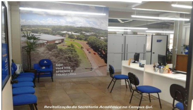
Revitalização da Secretaria Acadêmica no Campus Ijuí.