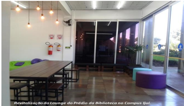
Revitalização do Lounge do Prédio da Biblioteca no Campus Ijuí.