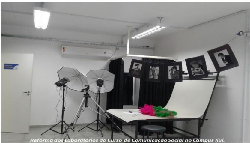
Reforma dos Laboratórios do Curso de Comunicação Social no Campus Ijuí.

As fotos acima são registros de melhorias no Campus Ijuí