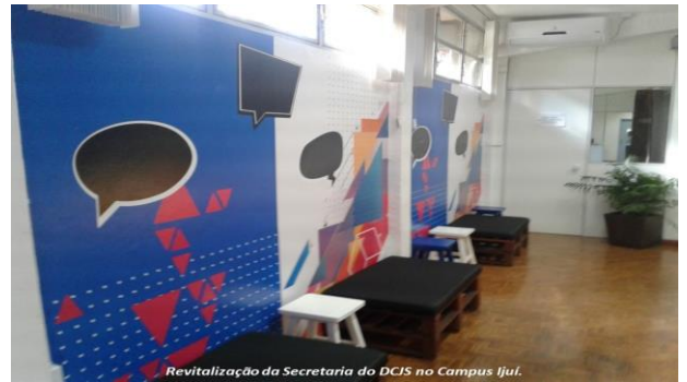
Revitalização da Secretaria do DCIS no Campus Ijuí.