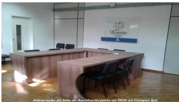
Adequação da Sala de Audiências junto ao DCJS no Campus Ijuí.