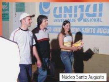
Núcleo Santo Augusto