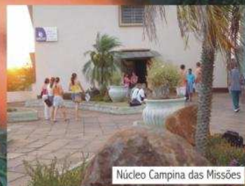
Núcleo Campina das Missões