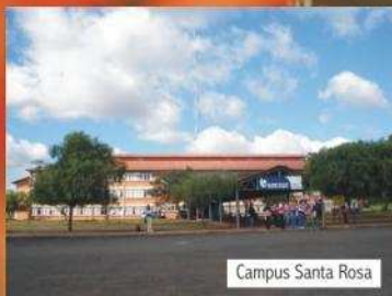
Campus Santa Rosa