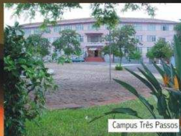
Campus Três Passos