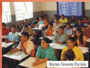
Núcleo Tenente Portela