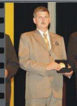
Troféu Responsabilidade Social