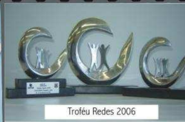
Troféu Redes 2006