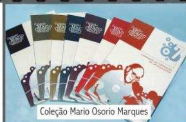
Coleção Mario Osorio Marques

FUNDAÇÃO DE INTEGRAÇÃO, DESENVOLVIMENTO E EDUCAÇÃO DO NOROESTE DO ESTADO