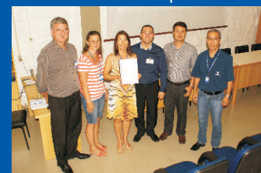
Entrega do Plano Museológico