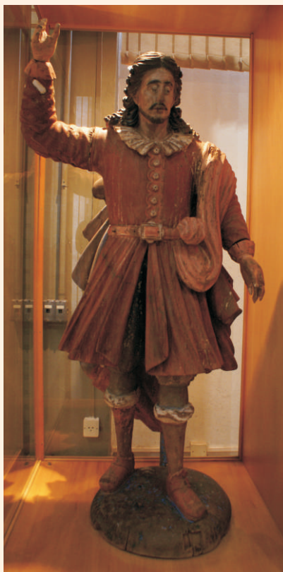
Imagem de Santo Isidro