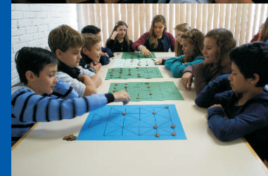
Oficina de Jogos