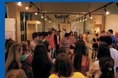
Alunos visitando exposição